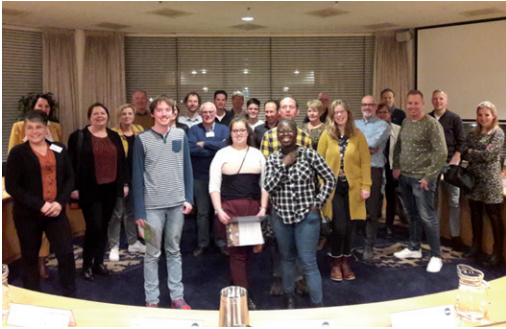
De Gasten van de Raad kwamen donderdagavond naar het stadhuis om meer te weten te komen over het werk van de gemeenteraad.

Enkele van de gasten over de bijeenkomst: "Een leuk initiatief, leuk om kennisgemaakt te hebben". "Dit was mijn eerste keer dat ik een vergadering van de gemeenteraad bijwoonde maar ik denk wel voor herhaling vatbaar, interessant hoe zo'n discussie zich in de vergadering ontwikkelt." "Goed om te weten dat je altijd naar de vergaderingen van de gemeenteraad kunt komen."