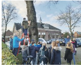
Leerlingen van basisscholen hangen mezenkastjes op in strijd tegen eikenprocessierups

Scouting Nijkerk en Hoevelaken, Accent, Aeres, Veense Kas en de Inclusief Groep hebben de nestkastjes gemaakt. Leerlingen van verschillende basisscholen hielpen met ophangen. Zij deden dat samen met raadsleden, vrijwilligers van het Instituut voor Natuureducatie (IVN) en medewerkers van de gemeente.