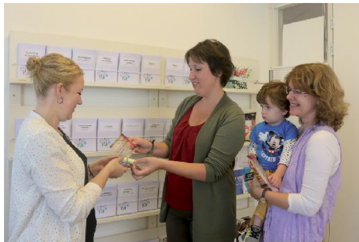
Erste exemplaren worden uitgedeeld aan creatieve meedenkers

Na een oproep voor 'creatieve meedenkers' hebben twee inwoners gereageerd. Al snel ontstond het idee om opvoedvragen uit te delen op het schoolplein en bij de kinderdagverblijven. Met als doel mensen uit te dagen met elkaar in gesprek te gaan over opvoeden. Om aan te sluiten bij het thema zijn er kaarten met verschillende opvoedvragen gemaakt met een stoepkrijt. Via Sigma en InteraktContour hebben vrijwilligers (met een beperking) geholpen om de meer dan 500 krijten aan de kaarten te binden. De contactpersonen vanuit de gebiedsteam en de intern begeleiders van de scholen hebben enthousiaste ouders ge-