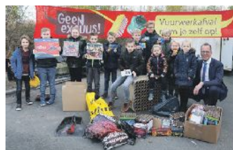
De prijswinnaars zijn blij met hun prijs!

meer schade en meer kosten. Voorafgaand aan de jaarwisseling doen medewerkers van wijkbeheer, de toezichthouders en de verkenners het nodige werk om schade zoveel mogelijk te beperken. Medewerkers van wijkbeheer sloten daarom vooraf afvalbakken, ondergrondse containers en brievenbussen af. Dit jaar is de schade aan de riolering, verkeersvoorzieningen