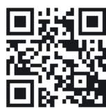
QR code iOS KWS app