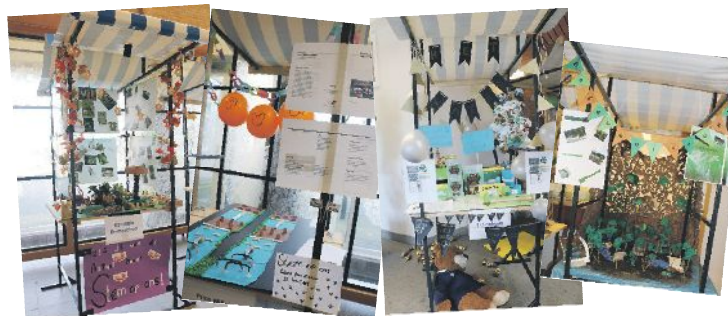
Net als vorig jaar zullen de scholen hun plannen voor de jeugdgemeenteraad presenteren in het stadhuis. De jeugdgemeenteraad beslist op 12 maart welk plan uitgevoerd wordt.

Alle deelnemende scholen zullen hun plan op 12 maart presenteren in een marktkraampje in het stadhuis. Overdag komen de leerlingen naar het stadhuis voor een rondleiding door het stadhuis en het geven van punten aan de plannen en presentaties. Er is ook een vakjury die de plannen beoordeelt. In de middag bereiden de 22 leerlingen die namens de scholen in de Jeugdgemeenteraad plaatsnemen zich met raadsleden voor op de vergadering. Vanaf 19.00 uur vergadert de Jeugdgemeenteraad. Net als bij de echte gemeenteraad, is de vergadering via de website van de gemeente Nijkerk vanuit huis te volgen. Alle plannen worden dan kort gepresenteerd.